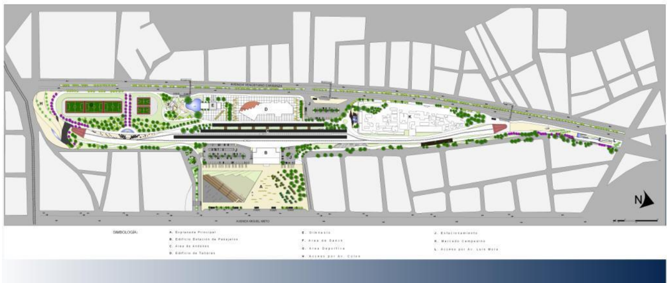
2.1.2 PLANO DE CONJUNTO