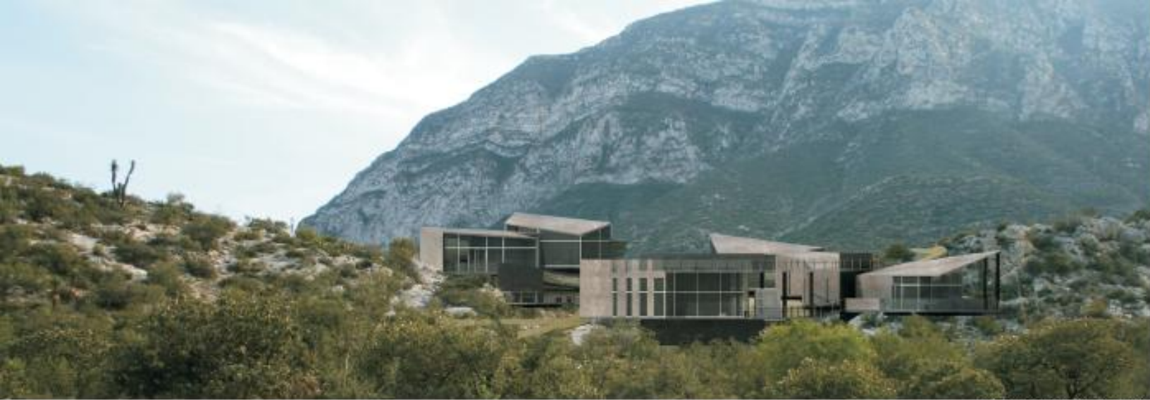
Centro de Recepción Cultural y Deportiva